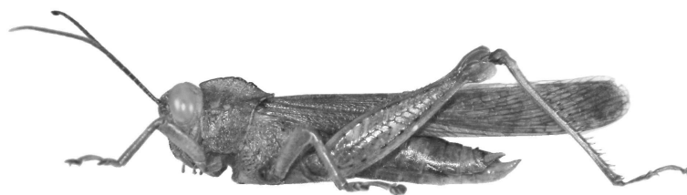
Abisares viridipennis mâle

Nous avons suivi ici ce point de vue, mais le statut des différentes sous-espèces est peut-être à réétudier. Otte (1995a, p. 266) conserve valides les sous-espèces A. viridipennis dromaderius et A. viridipennis hylaesus .